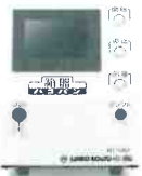
クリスタルホワイト

一 般 仕 様 ・供給電源 AC200V (単相) 50/60Hz ・消費電力 300W以下 ・使用温度 0~40℃ ・湿度範囲 10~85RH (結露しないこと)